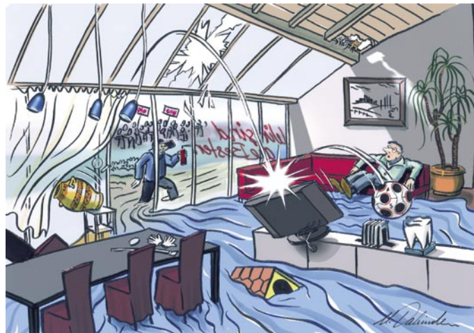
Illustration Visual Studio Marcel Dahinden, 2008